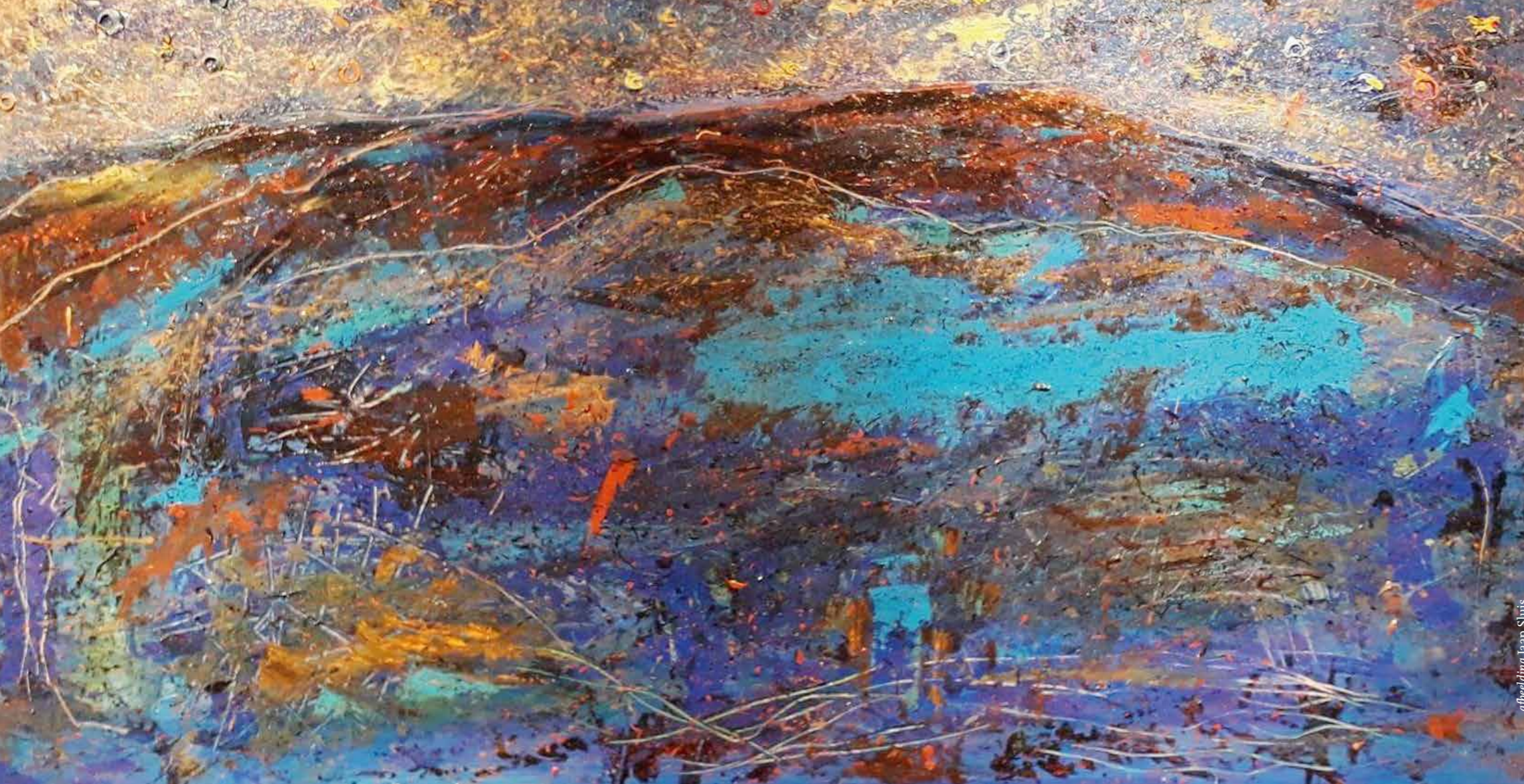
afbeelding Jaap Sluis